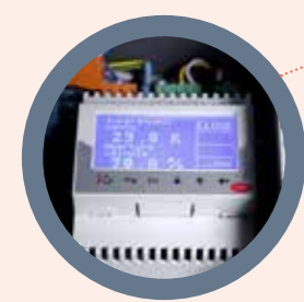
VALVOLA DI ESPANSIONE ELETTRONICA